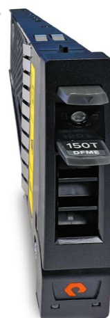
Das neue Modul von Pure Storage wird so klein bleiben wie eineinhalb iPhones – mit doppelter Kapazität: 300 Terabyte

Unsere Software ist wie das Betriebssystem eines Computers. Damit können Unternehmen Speicherkapazitäten in ihrem System zentral nutzen und verwalten und mit der Software die Regeln dafür selbst festlegen. Es ist auch möglich, bei Bedarf zusätzlichen, virtuellen Speicher aufzubauen, ähnlich