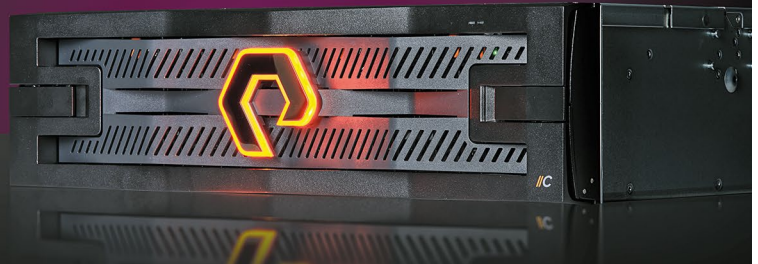
System von Pure Storage: Mit ihrer Technologie wollen die Kalifornier die Datenspeicherung aufwerten