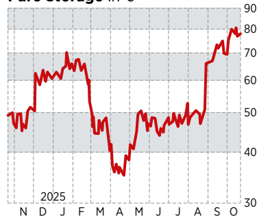
Pure Storage in €